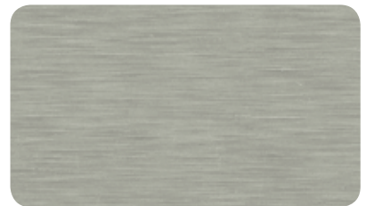
BUTLERFINISH EDELSTAHL BUTLERFINISH STEEL BUTLERFINISH ACIER