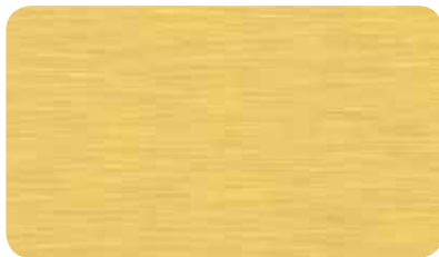
BUTLERFINISH GOLD BUTLERFINISH GOLD BUTLERFINISH OR