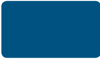
ENZIANBLAU GENTIAN BLUE BLEU GENTIANE I RAL 5010