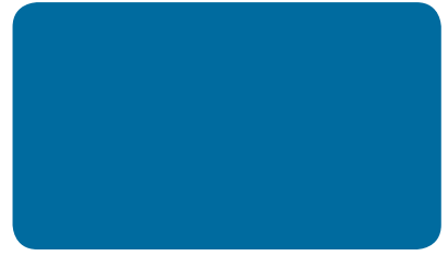
VERKEHRSBLAU TRAFFIC BLUE BLEU SIGNALISATION I RAL 5017