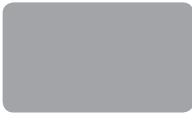
VERKEHRSGRAU A TRAFFIC GREY A GRIS SIGNALISATION A I RAL 7042