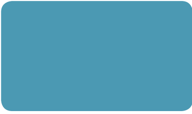
PASTELLBLAU PASTEL BLUE BLEU PASTEL I RAL 5024