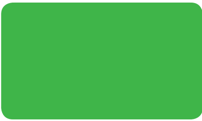
GELBGRÜN YELLOW GREEN VERT JAUNE