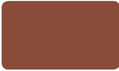
SIGNALBRAUN SIGNAL BROWN BRUN DE SÉCURITÉ