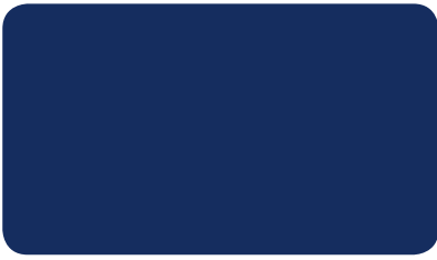
NACHTBLAU NIGHT BLUE BLEU NOCTURNE I RAL 5022