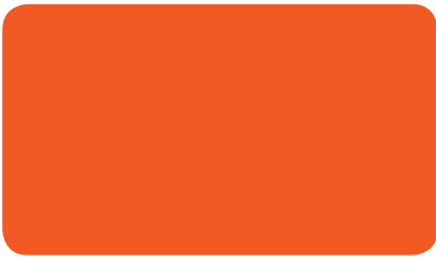
VERKEHRSORANGE TRAFFIC ORANGE ORANGÉ SIGNALISATION