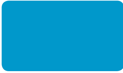
LICHTBLAU LIGHT BLUE BLEU CLAIR I RAL 5012