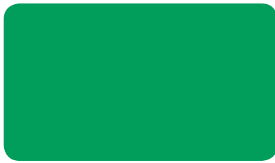
VERKEHRSGRÜN TRAFFIC GREEN VERT SIGNALISATION