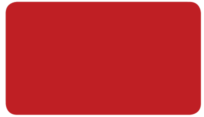
SIGNALROT SIGNAL RED ROUGE DE SÉCURITÉ