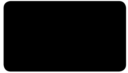
VERKEHRSSCHWARZ TRAFFIC BLACK NOIR SIGNALISATION I RAL 9017