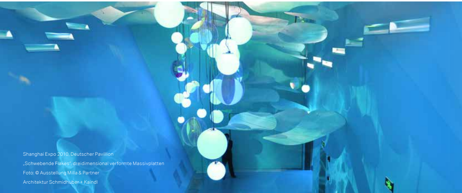
Shanghai Expo 2010, Deutscher Pavillion „Schwebende Flakes“, dreidimensional verformte Massivplatten Foto: © Ausstellung Milla & Partner Architektur Schmidhuber + Kaindl

und platte Materie über sich hinauswachsen soll.